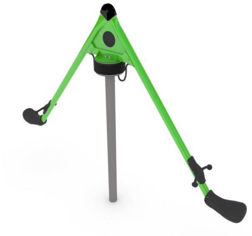
Rys. 3. Karuzela wahadłowa.